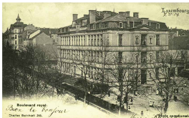
Carte postale : Le Boulevard Royal avec l'École Aldringen et, tout au fond, le Grand Hôtel Brasseur.

En effet, cette allusion de Joyce ne veut dire rien d'autre qu'il se met au Luxembourg chaque jour à la tâche de continuer son opus magnum . Peut-être aussi que la night school et les pothooks lui sont rappelés par le grand bâtiment de l'École Aldringen qui ne se trouve qu'à quelques pas du Grand Hôtel Brasseur et qu'il voit tous les jours en déambulant dans la ville. Cette école est considérée à l'époque comme le modèle pour les établissements scolaires à construire dans les différentes communes du pays.